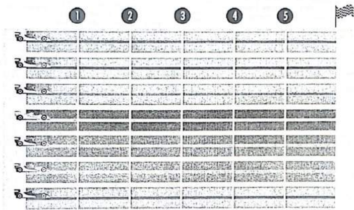
* Imagen referencial de la pista de carreras

Los 7 finalistas del JUEGO DE AZAR 2 participaran de la carrera de autitos, conforme a lo siguiente: